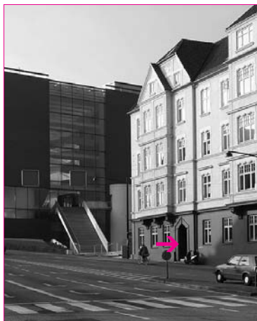
DMF's nye hovedkontor