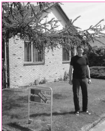
Hovedkontoret sættes til salg