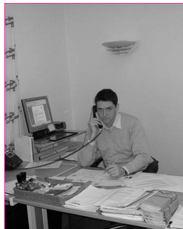
Det nye kontor er taget i brug