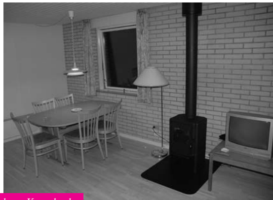
Fra de renoverede huse, Kærneland.

Men i det store hele var de første 3 huse fine, og som det kan ses på billederne ser husene meget anderledes ud indvendigt nu. De er blevet lyse og venlige, hvilket får husene til at virke meget større.