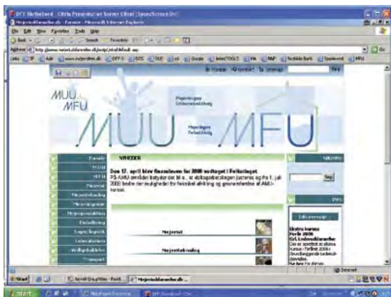
Hjemmeside til Mejeribrugets Uddannelsesudvalg (MUU)/ Mejerifaget Fællesudvalg (MFU)

DMF har lagt et direkte link til denne uddannelses hjemmeside, selvfølgelig lagt på DMF's egen hjemmeside www.mejeringen.dk .